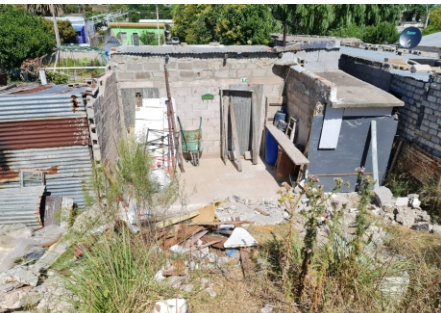
EN ESTAS CONDICIONES SE ENCONTRABA LA VIVIENDA A POCO DEL ACCIDENTE.