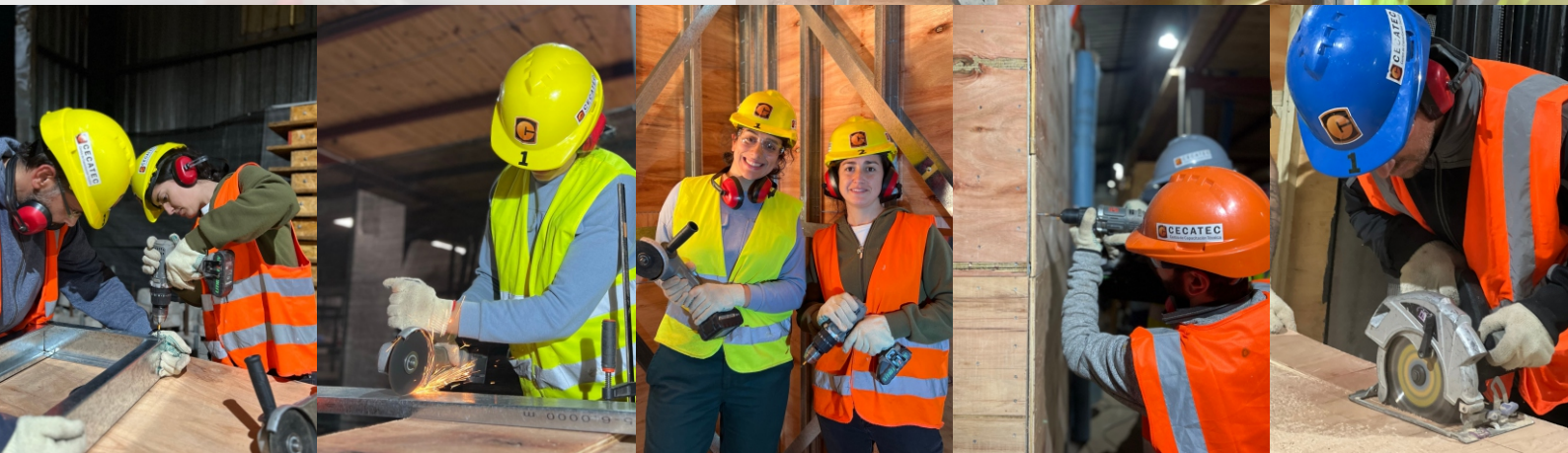
ARRIBA: SHOPPING PASEO DEL ESTE, LUGAR DE DICTADO DE LOS CURSOS DE STEEL FRAMING. ABAJO: LOS GRUPOS DE ALUMNOS Y PARTE DEL TRABAJO REALIZADO.