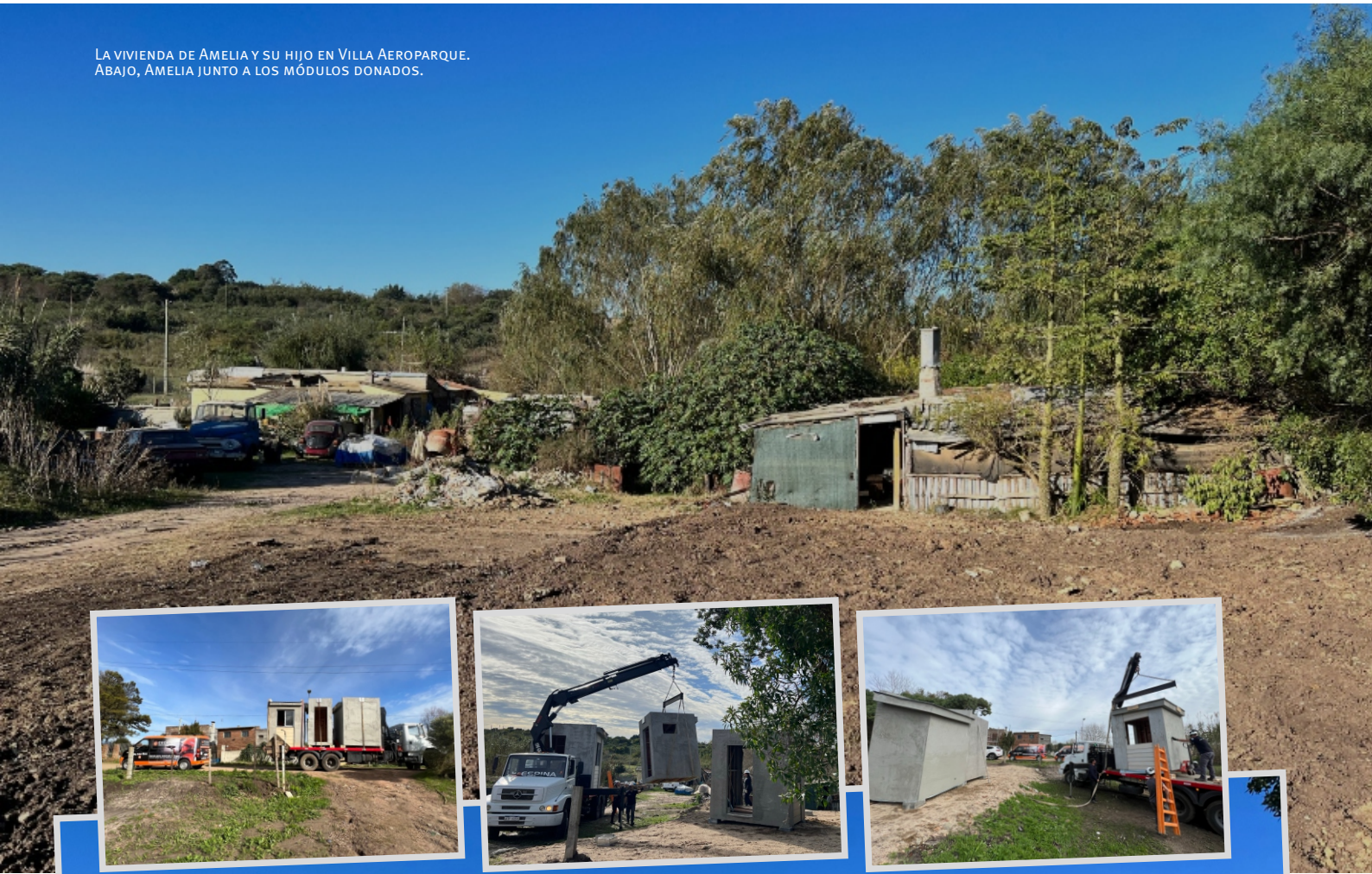
LA VIVIENDA DE AMELIA Y SU HIJO EN VILLA AEROPARQUE. ABAJO, AMELIA JUNTO A LOS MÓDULOS DONADOS.