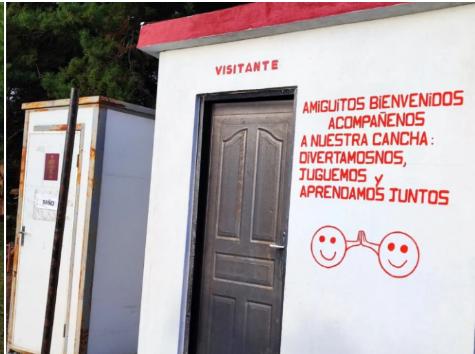
ASÍ LUCEN ACTUALMENTE LOS MÓDULOS LUEGO DE LAS INTERVENCIONES ARTÍSTICAS.