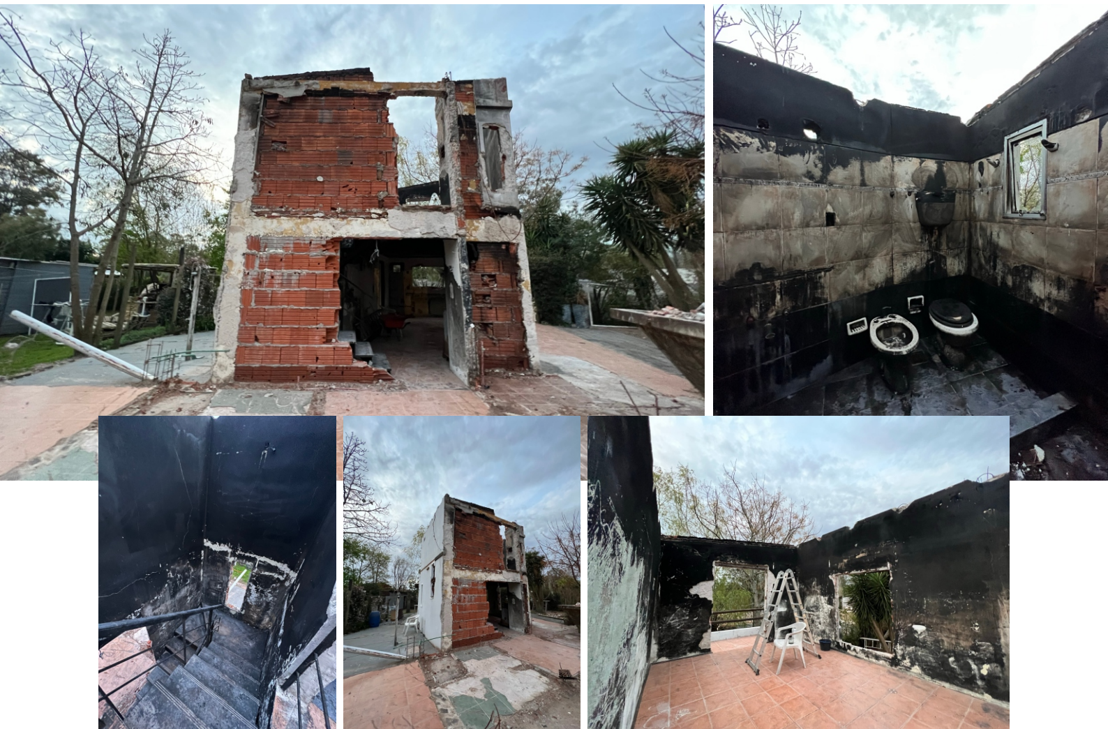
EL ESTADO EN QUE QUEDÓ LA VIVIENDA LUEGO DEL INCENDIO.

Agradecemos en primer lugar a nuestros grupos de Instalador de Steel Framing e Instalador de Drywall, que se sumaron a la causa desde el primer minuto. También a Inefop, por seguir convocándonos y por elegir la mejor capacitación de Steel framing del Uruguay. Y por supuesto, a Paseo del Este, que hizo posible el dictado de los cursos en sus instalaciones, en una ubicación inmejorable del departamento de Maldonado.