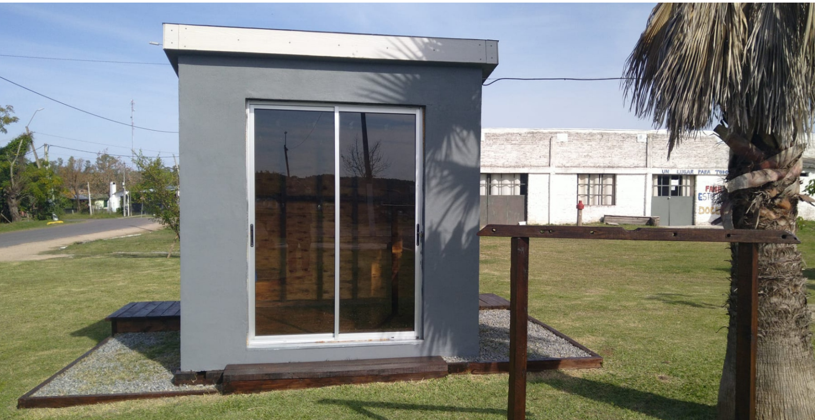
ASÍ LUCE ACTUALMENTE EL MÓDULO EN PIEDRAS COLORADAS, PARA DISFRUTE DE LOS ARTESANOS DE LA LOCALIDAD Y DE SU GENTE.