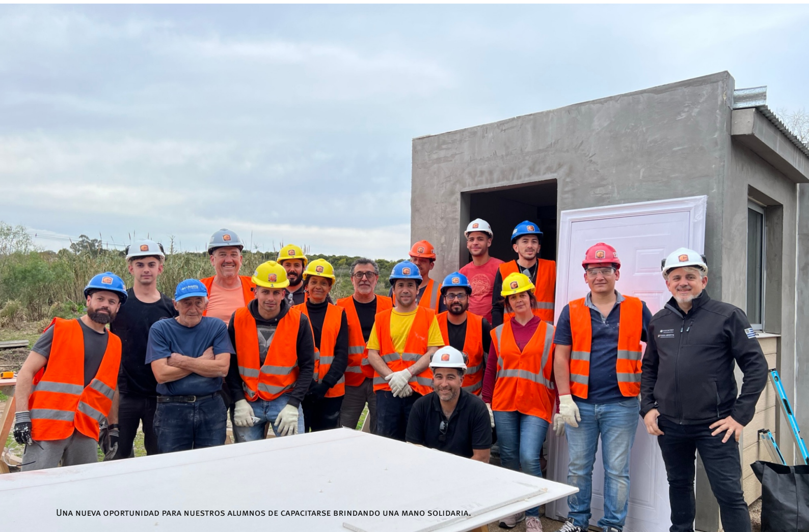
UNA NUEVA OPORTUNIDAD PARA NUESTROS ALUMNOS DE CAPACITARSE BRINDANDO UNA MANO SOLIDARIA.