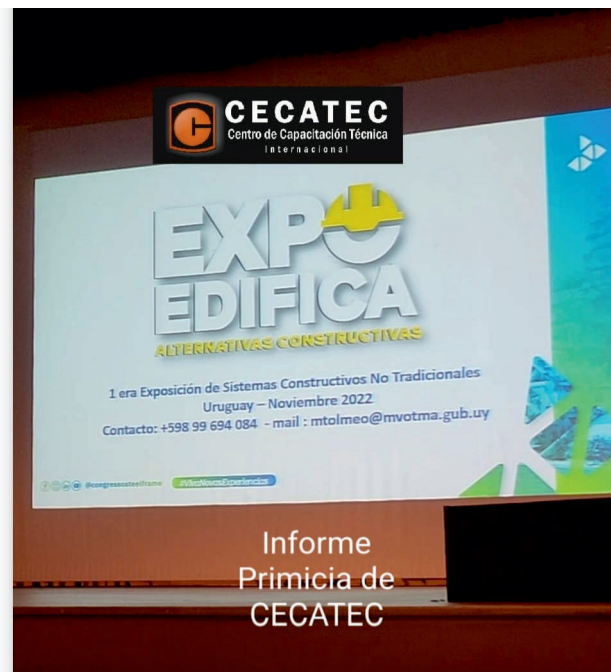
ANUNCIO DE EXPO EDIFICA DURANTE EL CONGRESO