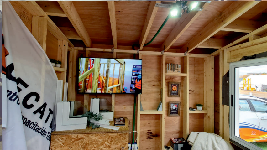
INTERIOR DE UNO DE LOS MÓDULOS CONSTRUIDOS DURANTE LOS CURSOS, EXHIBIDO EN LA FERIA